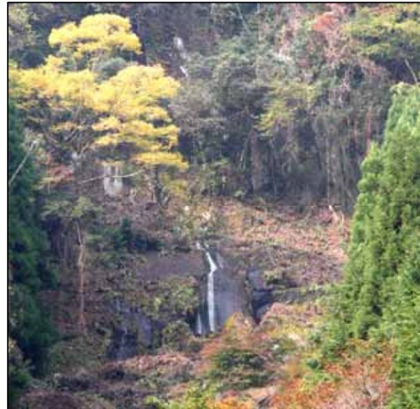
修景により常時見えるようになった高平の滝

耶馬溪の奇岩・秀峰による独特の溪谷は、その美しさから大正12年3月7日に「名勝耶馬溪」として国の名勝（文化財）の指定を受けました。しかし、近年は、指定からかなりの年数が経過していることに加え、管理の難しさから木々が伸び過ぎてしまい、名勝として指定された当時の良好な景観が損なわれていました。この度、地元住民のみなさんのご協力と地権者の方々のご理解をいただき、「名勝耶馬溪」の修景が実施され、指定当時の姿を再生することができました。