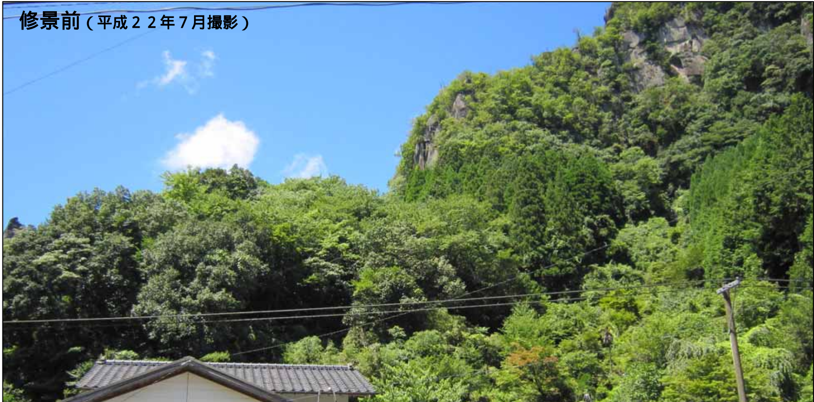
修景前（平成22年7月撮影）