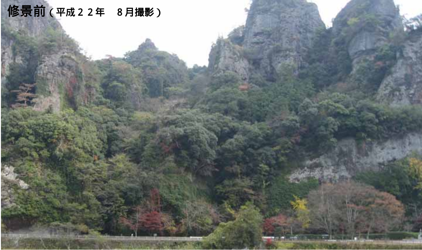
修景前（平成22年 8月撮影）