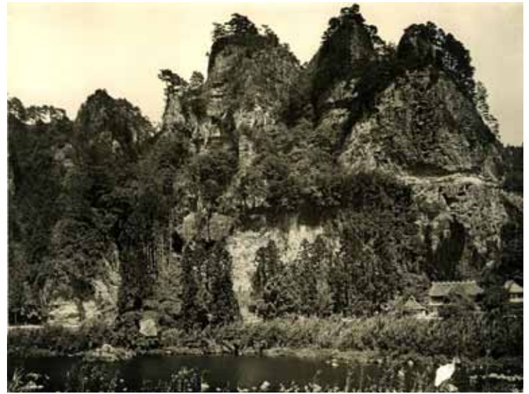
昭和初期頃の競秀峰

耶馬溪の奇岩・秀峰による独特の渓谷は、その美しさから大正12年3月7日に「名勝耶馬溪」として国の名勝（文化財）の指定を受けました。しかし、近年は、指定からかなりの年数が経過していることに加え、管理の難しさから木々が伸び過ぎてしまい、名勝として指定された当時の良好な景観が損なわれていました。この度、地元住民のみなさんのご協力と地権者の方々のご理解をいただき、「名勝耶馬溪」の修景が実施され、指定当時の姿を再生することができました。