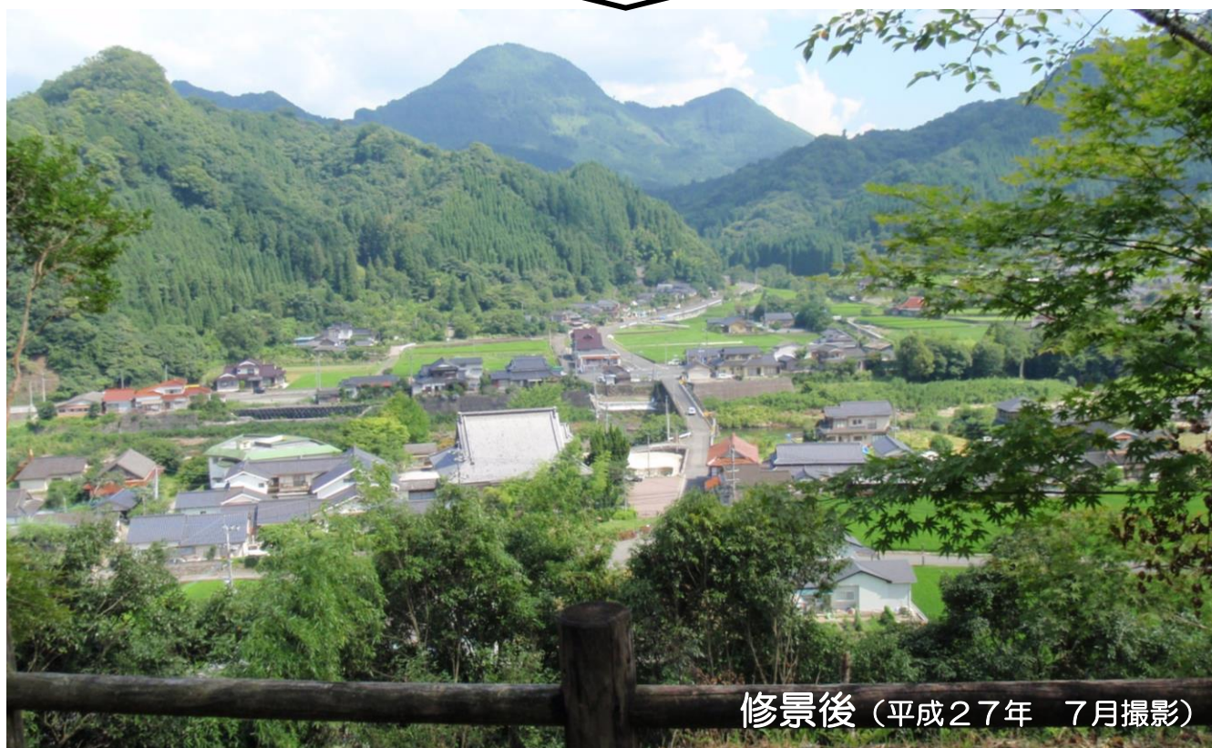
修景後（平成27年 7月撮影）