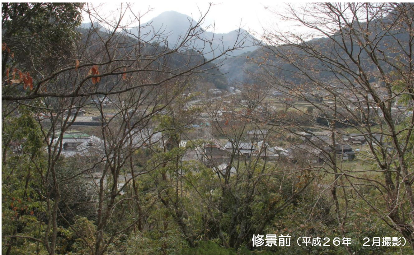
修景前（平成26年 2月撮影）