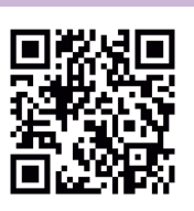
▲「内水ハザードマップ」のホームページはコチラ