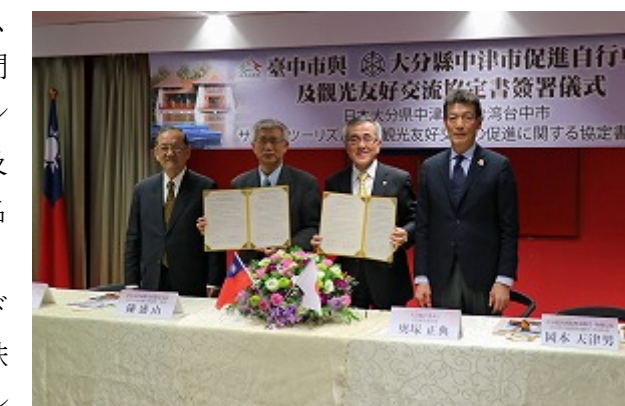
左から、林副市長、陳局長、奥塚市長、岡本局長

今回は、他に后豊鉄馬道（台中市）4.5 km をレンタサイクルで実走し、鉄橋やトンネルなど鉄道の名残を視察、CHC 財団（自転車による健康科学に関する研究機関）や GIANT 社（台中を拠点とする台湾が誇る自転車の世界企業）のフラッグシップショップなども訪問しました。