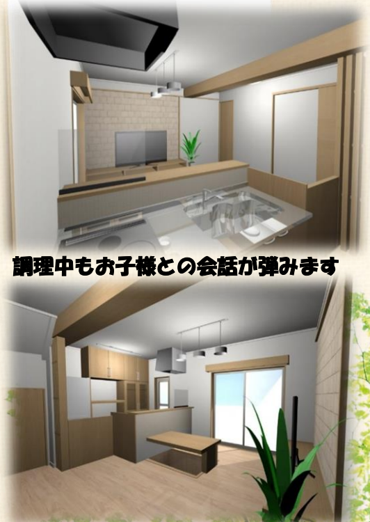
調理中もお子様との会話が弾みます