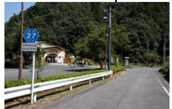
市営深耶馬温泉館もみじの湯