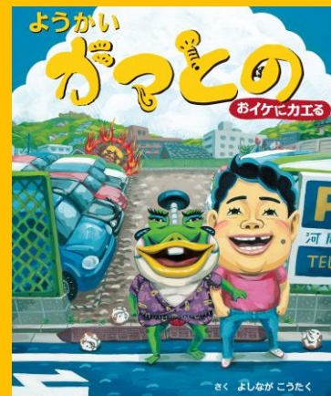
『ようかいガマとの おいけにカエる』2011年