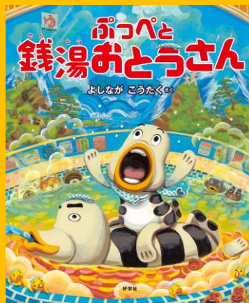
『ぷっぺと銭湯おとうさん』2009年