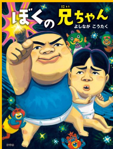
『ぼくの兄ちゃん』2013年