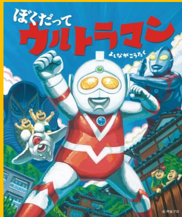
『ぼくだってウルトラマン』2013年