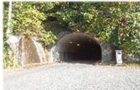
白水トンネル（耶馬溪）