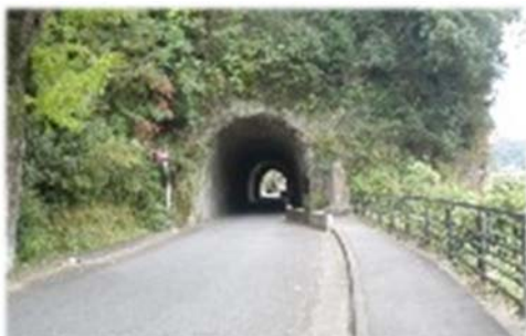
洞門隧道（本耶馬溪）