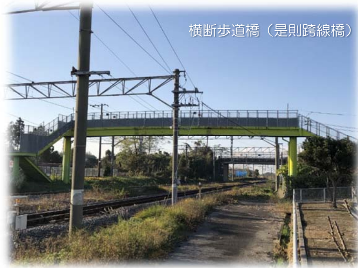
横断歩道橋（是則跨線橋）