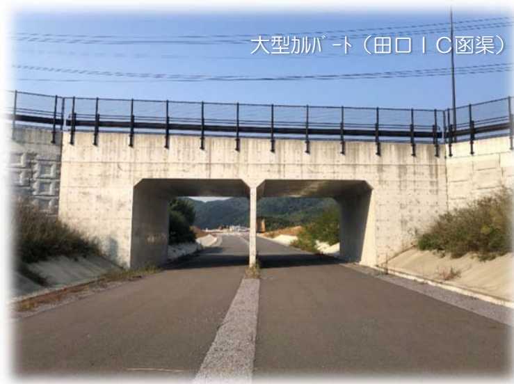
大型加幅ト（田口IC函渠）