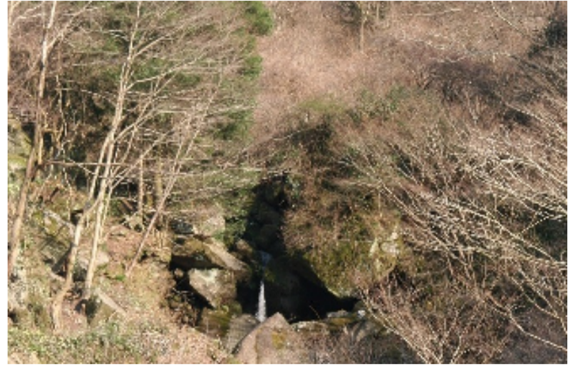
修景により滝が常時見えるようになりました

この度、地元住民のみなさんのご協力と地権者の方々のご理解をいただき、「名勝耶馬溪」の修景が実施され、指定当時の姿を再生することがで