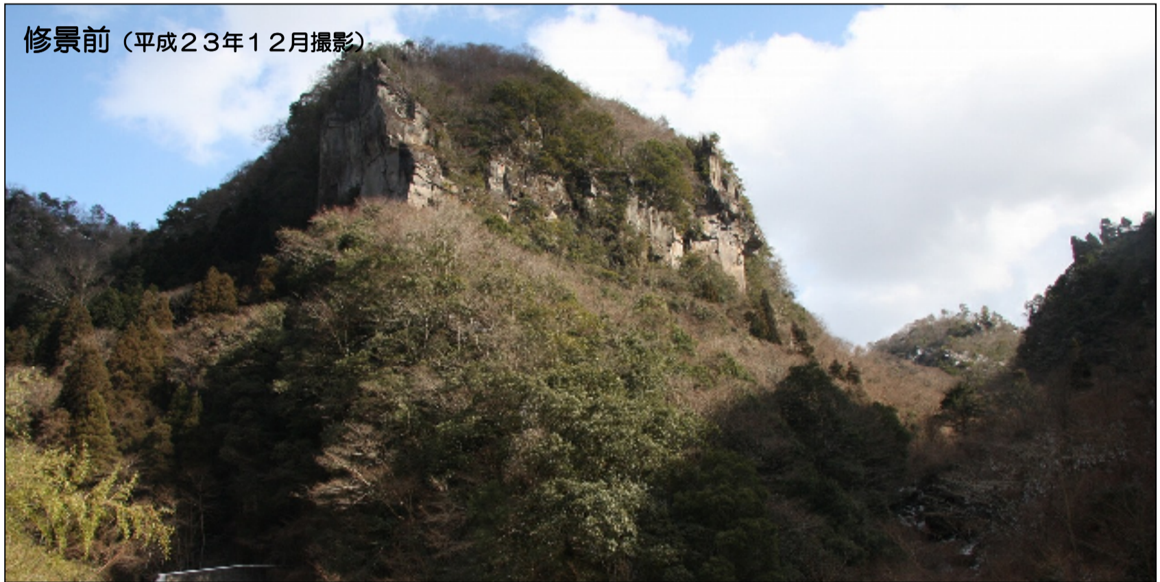
修景前（平成23年12月撮影）