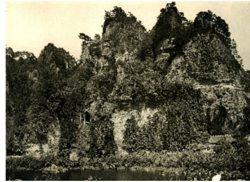
昭和初期頃の競秀峰

耶馬溪の奇岩・秀峰による独特の渓谷は、その美しさから大正12年3月7日に「名勝耶馬溪」として国の名勝（文化財）の指定を受けました。しかし、近年は、指定からかなりの年数が経過していることに加え、管理の難しさから木々が伸び過ぎてしまい、名勝として指定された当時の良好な景観が損なわれていました。この度、地元住民のみなさんご協力と地権者の方々のご理解をいただき、「名勝耶馬溪」の修景が実施され、指定当時の姿を再生することができました。