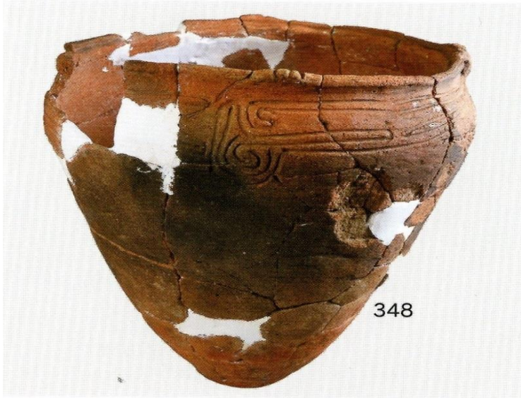
SH24 出土遺物 (1)