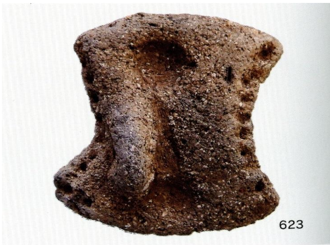
3次 SK3 出土遺物 (4)