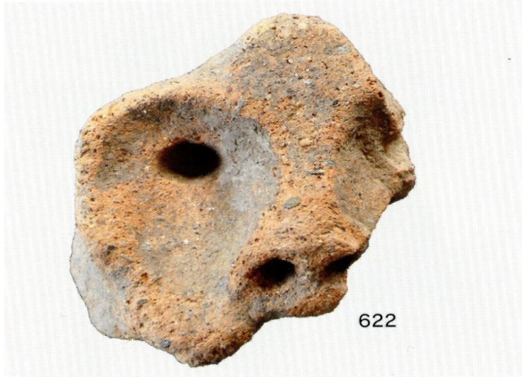
3次 SK3 出土遺物 (1)

正位の状態で出土しているため、SH24埋没時に、土器の下半部を打ち欠き、上半部のみを意図的に据え置いたものと考えられる。住居廃絶に伴う祭祀行為を示す貴重な遺物である。