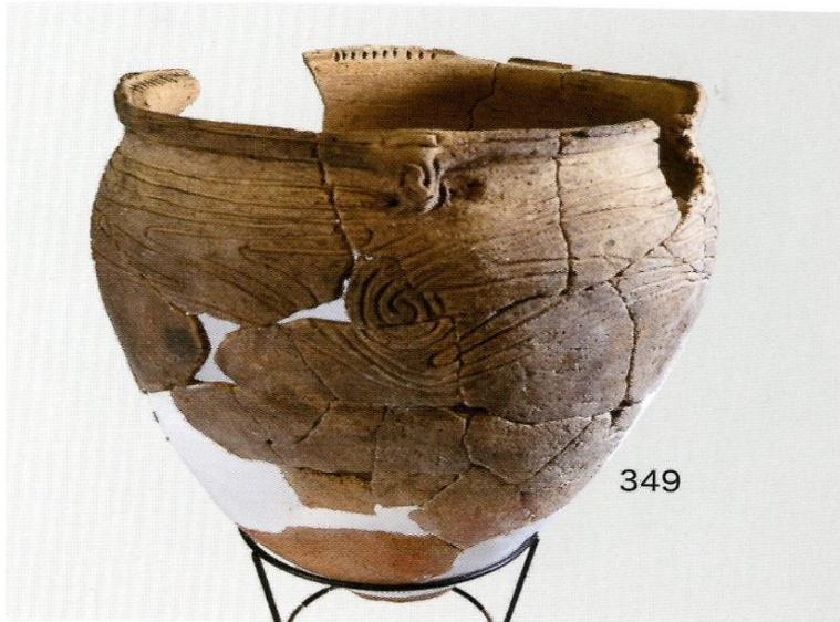
SH24 出土遺物 (2)