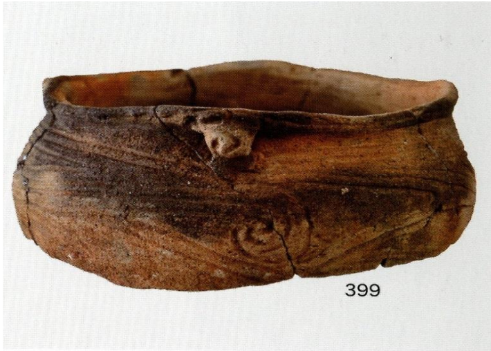
SH24 出土遺物 (2)