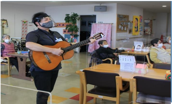
ペルーから音楽療法専任講師 みなさん大好きな時間♪