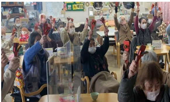
鳴子体操 打楽器を使ってひだまりオリジナル体操！