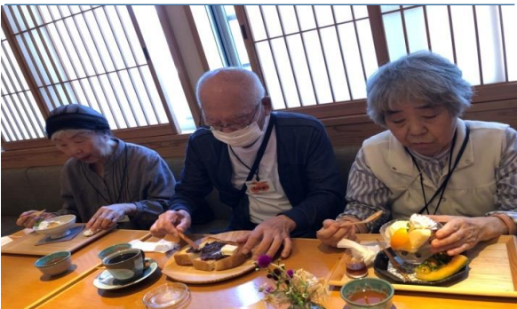
野外活動 地域の喫茶店に出掛けておやつを堪能！