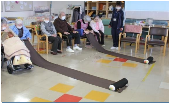
レクリエーション 職員の手作りレクで体を動かし笑いも沢山！