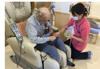
リラクゼーション