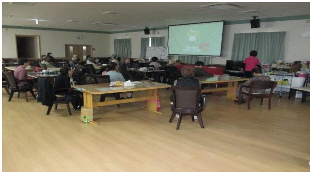
めじろん体操の様子