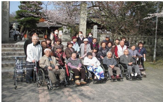
機能訓練を兼ねた外出行事