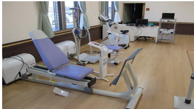
運動療法（パワー機器）