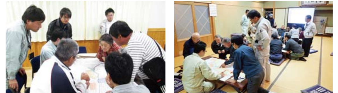
地域説明会(ワークショップ)の様子

平成30年3月末までに指定された「土砂災害警戒区域(特別警戒区域)」1,012区域について、自分の住んでいる地域のどこに「がけ崩れ」「土石流」「地すべり」の危険があるのを知ってもらい、日頃から注意してもらうため、昨年の8月から、地域住民の意見を取り入れながら「土砂災害ハザードマップ」を作成しています。完成した「土砂災害ハザードマップ」は、該当する地域に順次配布します。