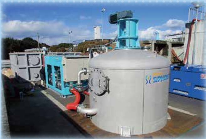
可搬式浄水装置を導入