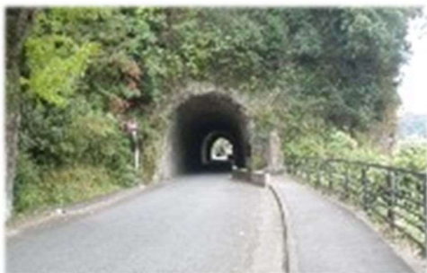
洞門隧道（本耶馬溪）