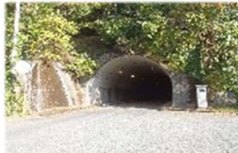
白水トンネル（耶馬溪）