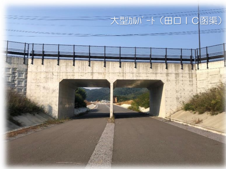
大型加幅ト（田口IC函渠）