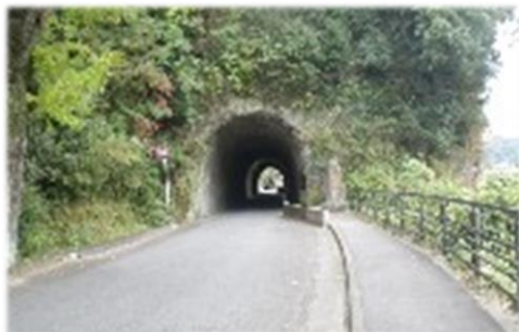
洞門隧道（本耶馬溪）