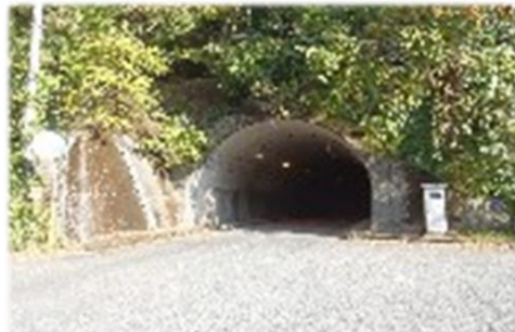
白水トンネル（耶馬溪）