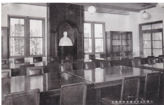
移転前の図書館 閲覧室 (現在の新中津市学校)