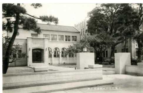
移転前の図書館 (現在の新中津市学校)