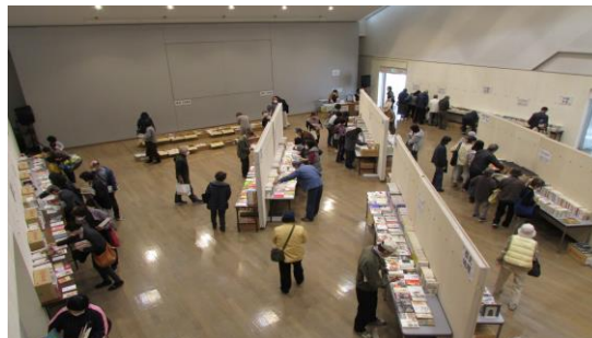
リサイクル図書（除籍本）無料配布