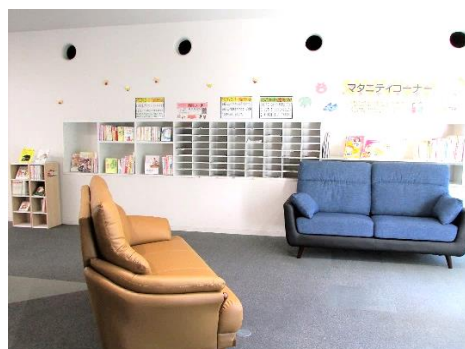
マタニティコーナー