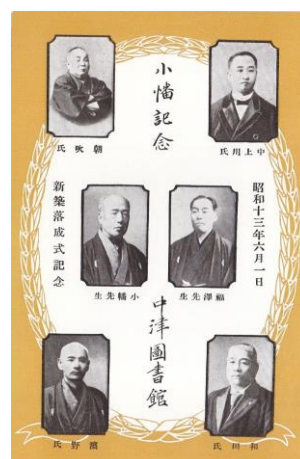
移転前の図書館 新築落成式記念カード