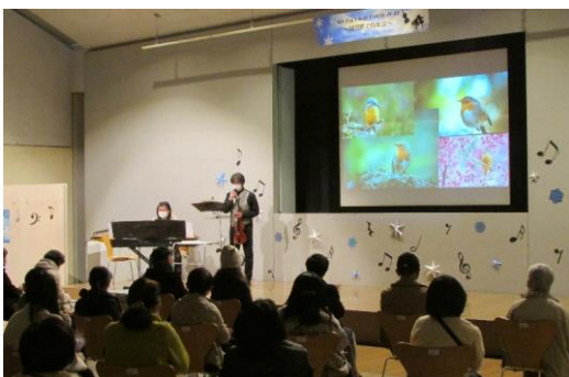
図書館コンサート

妊娠中の方、赤ちゃん連れの方がゆっくりくつろげる優先席として、妊娠・出産・育児の本棚の近くにソファを設置しています。