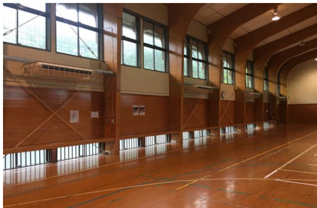
東京オリンピック・パラリンピック事前キャンプ地誘致活動<マレーシア>