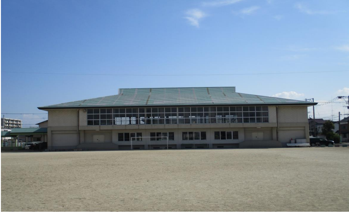
屋内運動場 改修後