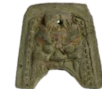
▲虚空蔵寺跡出土鬼瓦 (慶應義塾大学 文学部民族考古学研究室蔵)