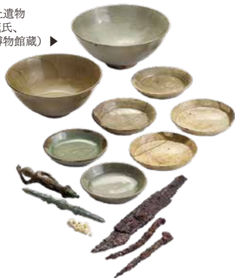
瑞雲寺遺跡出土遺物 (撮影: 牛嶋 茂氏、 大分県立歴史博物館蔵) ▶