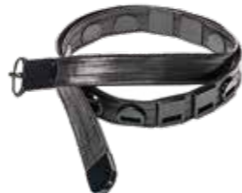
▲烏油腰帯 (奈良文化財研究所蔵)