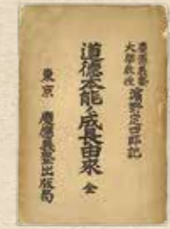
▲浜野定四郎書 「道徳本能ノ成長由来」