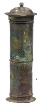
◀山ノ下経塚出土銅製経筒 (東京国立博物館蔵)