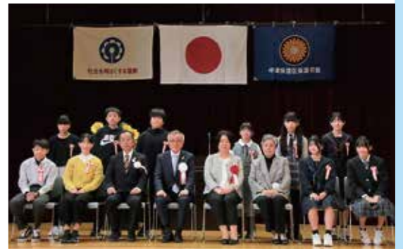
▲令和5年度 中津地区「社会を明るくする運動」作文コンテスト表彰式