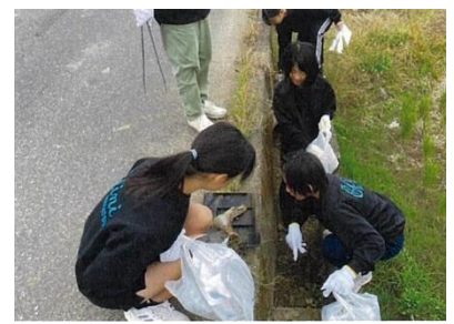
中津市内の様々な団体等に支援しています。