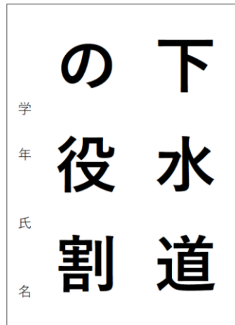
小学生高学年の部