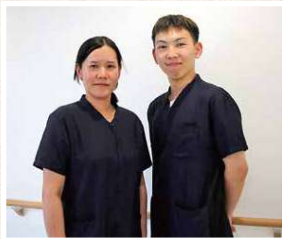
夜勤者ユニホーム