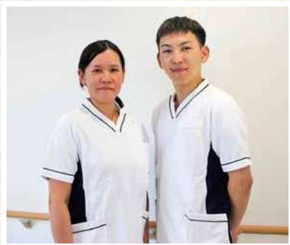
日勤者ユニホーム

中津市民病院の看護職員のユニホームが令和3年12月から変わりました。従来の紺色・青色ユニホームは夜勤者用とし、日勤者は白色のユニホームを新たに導入しました。これにより、周囲から夜勤者と日勤者が区別でき、交替する時間帯でそれぞれの役割を明確にすることで業務改善につなげていきたいと考えています。