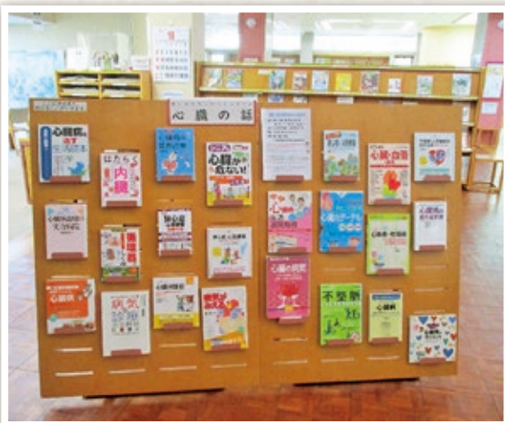
「心臓の話」コーナー