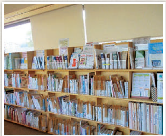
宇佐市民図書館 医療・健康情報コーナー