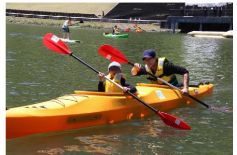
2人乗りカヌーの様子