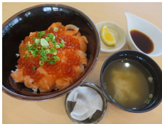
(新メニュー)トロサーモンとたっぷりいくらの親子丼