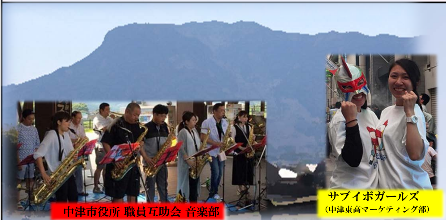
中津市役所 職員互助会 音楽部