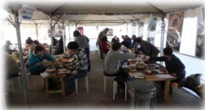
— 去年の様子 —

【営業期間】 2018年1月26日(金)～3月11日(日)【金・土・日のみ】 ※ 無くなり次第、終了。 【営業時間】 11時～15時(ラストオーダー14時) 【場 所】 中津市小祝漁港内(荷捌所) 【予約・問合せ先】 大分県漁業協同組合 中津支店 0979-22-2103 (平日のみ、9時～17時)