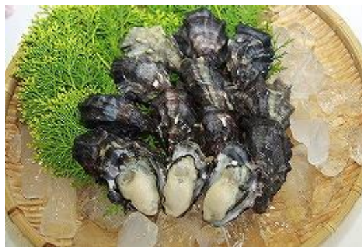
甘くサッパリとした味わいが特徴です