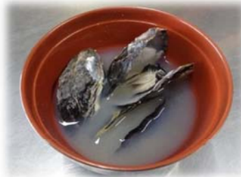
— カキ汁 —