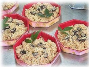
— カキ飯 —

日本初！干潟で養殖された牡蠣 「ひがた美人」は最先端の技術で 養殖され、プリッとした身と 濃厚で鮮烈な甘さが特徴です。