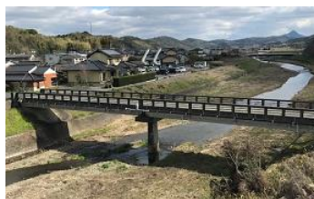
監視カメラ映像 (イメージ)