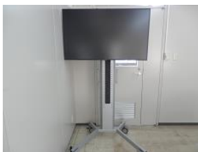
監視用モニター (支所)