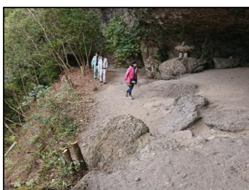
妙見窟へは公共駐車場から20分