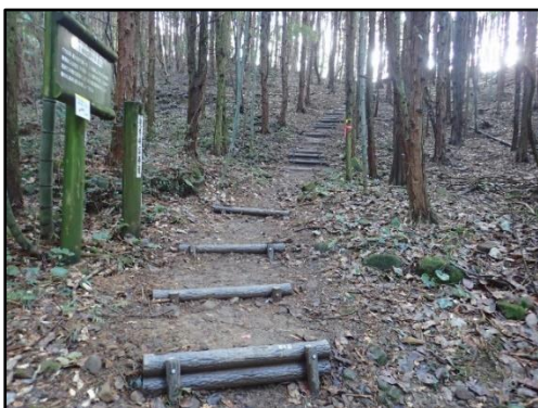
階段を整備しました