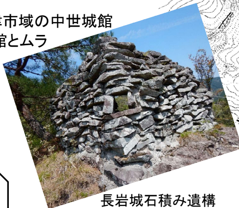
長岩城石積み遺構