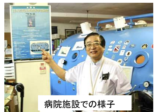
病院施設での様子