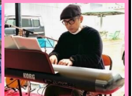
Nun Da Monday

会場:南部まちなみ交流館 中津市諸町1828番地 【お問合せ】0979(23)6070