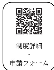
制度詳細 申請フォーム