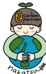
中津市ゼロカーボン推進パートナー ロゴマーク

中津市では2050年までに二酸化炭素排出を実質ゼロにする「ゼロカーボンシティ」の実現に向けて、一緒に取り組んでいただける市内の事業者及び団体をパートナーとして認定する「中津市ゼロカーボン推進パートナー制度」を開始しました。