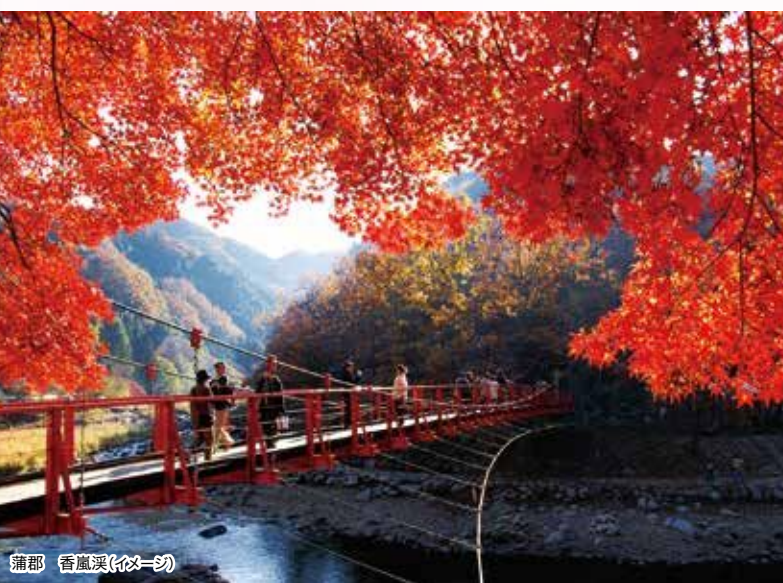
蒲郡 香嵐溪(イメージ)