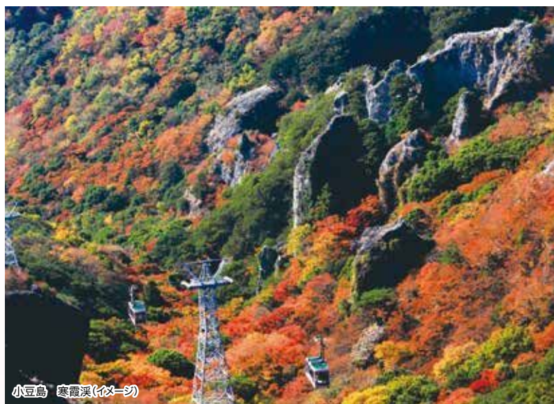
小豆島 寒霞溪(イメージ)