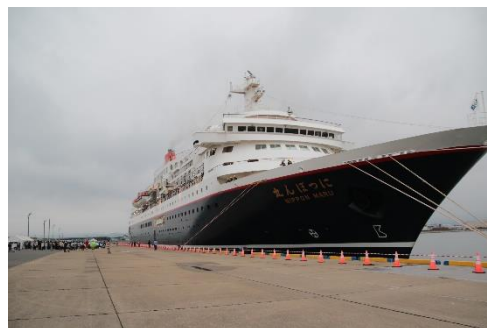
写真：にっぽん丸寄港の様子（R6 中津港）

日 時：令和7年11月7日（金曜日） 入港時間 9時00分（予定） 出港時間 17時00分（予定） 場 所：中津港（多目的国際ターミナル）