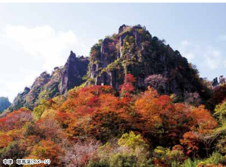
中津 耶馬溪(イメージ)