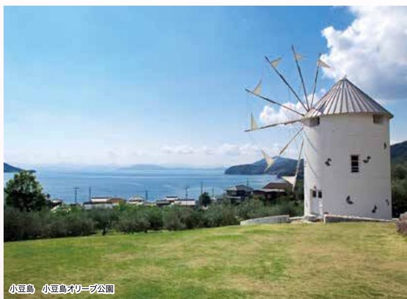
小豆島 小豆島オリーブ公園