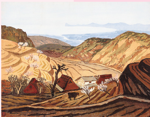
武田由平 《暖日》1940年 中津市木村記念美術館