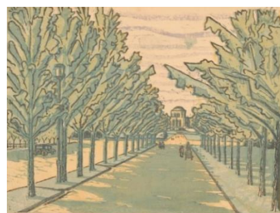
藤森静雄 《大東京十二景の内 六月外苑の新緑》 1933年 大分市美術館