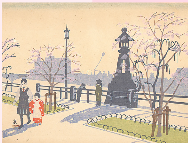
小泉癸巳男 《墨田公園・向島言問》1932年 大分市美術館