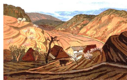
武田由平 《暖日》1940年 中津市木村記念美術館