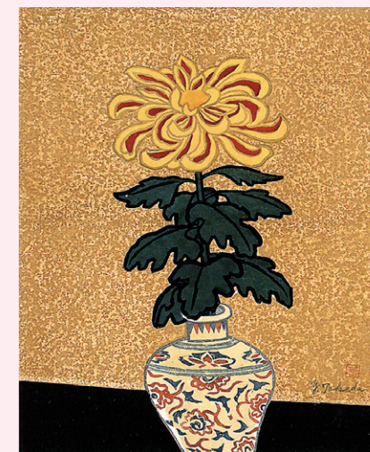
武田由平 《菊》1965年 中津市木村記念美術館