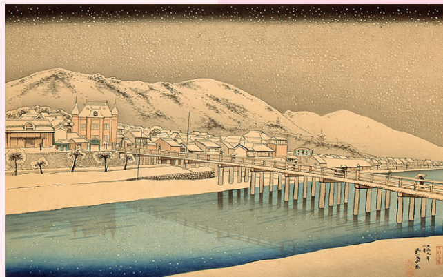
橋口五葉 《京都三条大橋》1920年 大分市美術館