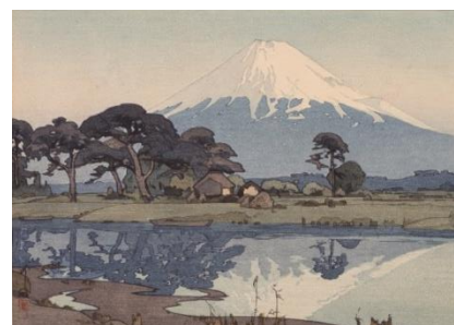
吉田博 《鈴川》1935年 大分市美術館