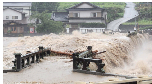
【R5. 7月豪雨時の耶馬溪橋の被災状況】